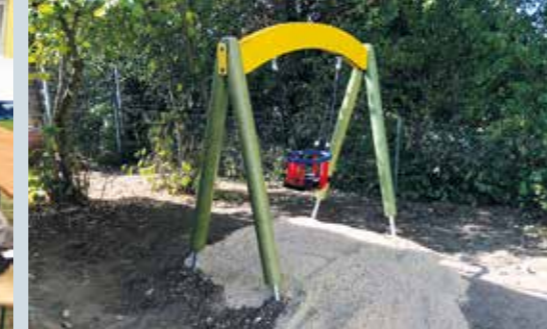
Die neue Schaukel