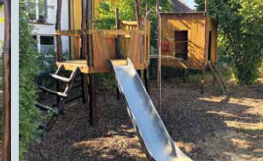
Abgeschliffen und neu gestrichen