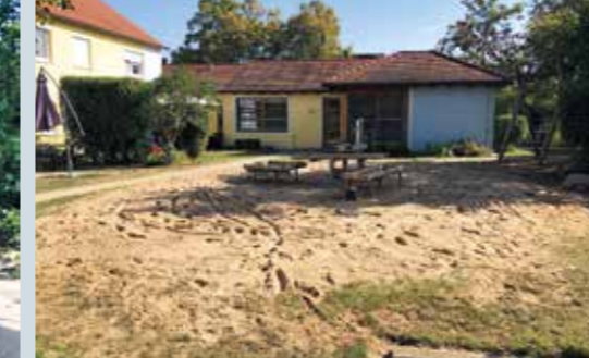
Am Tag danach