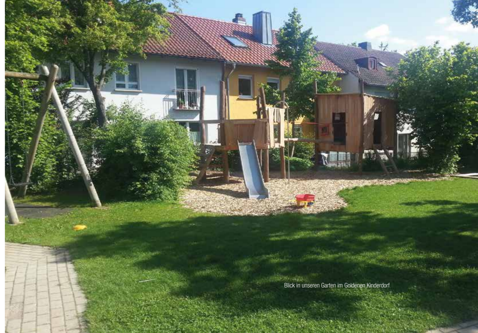
Blick in unseren Garten im Goldenen Kinderdorf

Wir sind Mitglied beim Caritasverband für die Diözese Würzburg e. V.