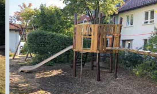
Sieht aus wie neu